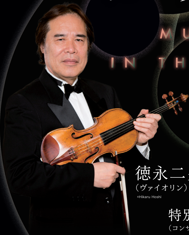
徳永二男 (ヴァイオリン)