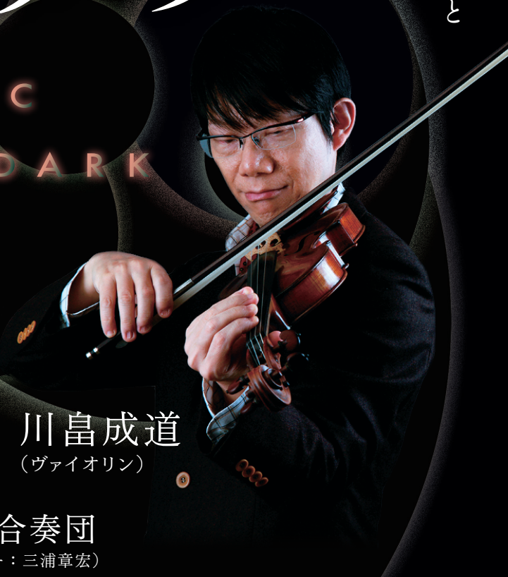
川島成道 (ヴァイオリン)