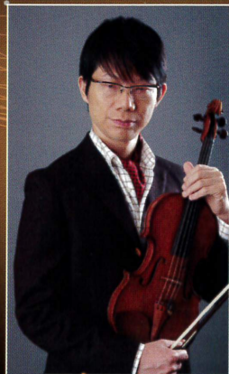
ヴァイオリン 川島成道 (かわはたなりみち)

視覚障がいのある世界的ヴァイオリニストの川島成道と、新進気鋭の18歳の異才ピアニスト紀平凱成が出演します。心に響くコンサートをご堪能ください。